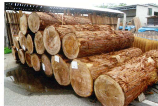
国産の秋田杉を取り寄せて、建材以外の部分を有効利用しています。

「和膳」はもともと料理店です。今回、自信を深めたのでした。そこで、今回は初回登場のサイズを大として、中と小サイズを加えて3サイズのご提案です。もともと「組子」は、建具に用いられてきた伝統技法。葉鉋と呼ばれる組子用の特殊な鉋で細工した薄く小さい木の板を、文様の外枠内に一つ一つ組み込んでいくことで、端正で美しい吉祥文様が完成します。熟練の職人による、気の遠くなるような地道な作業の繰り返しによって成る吉祥文様。そんな手仕事の温もり溢れる吉祥柄を備える「和膳」は、おもてなしの気持ち、華やぎと温もりで演出します。